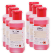
H 100 PERFECT CAIXA 6X1 L