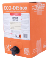
ECO-DISBOX H100 PERFECT BAG IN BOX 5L