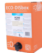
ECO-DISBOX H200 PERFECT BAG IN BOX 5L