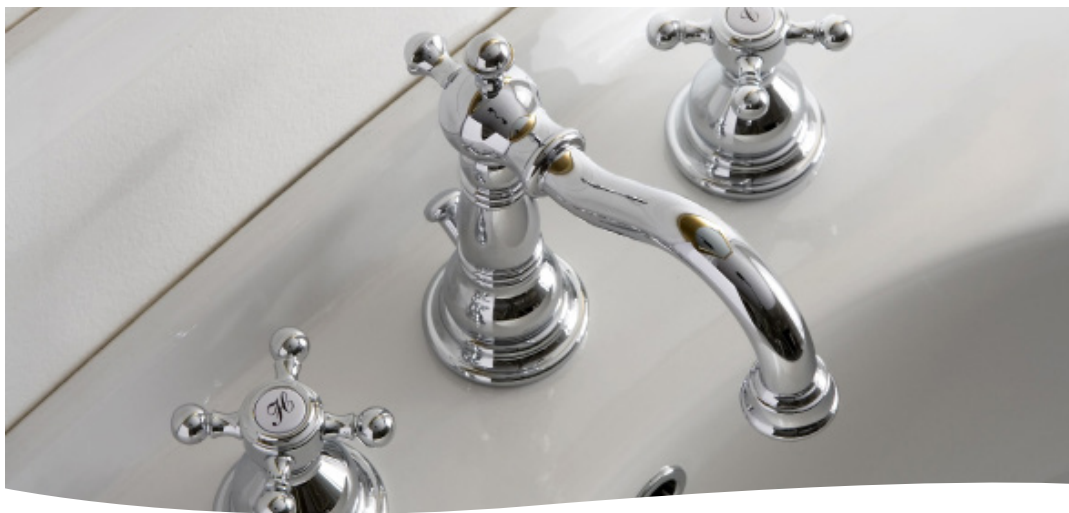
Gama H100 - Detergente diário para casas de banho