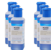
H 200 PERFECT CAIXA 6X1 L