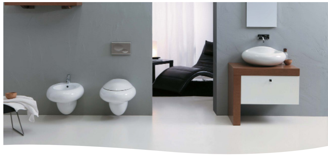
Gama H200 - Detergente diário para interiores